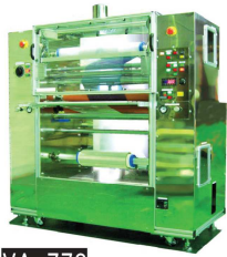
VA-770 外装SUS/DFR用巻取 安全カバー/排気ダクト