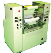
VA-570 クリーニングロール パネル両端ピンガイド