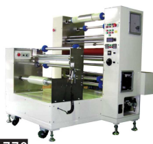
VA-770 基材巻出・製品巻取組込