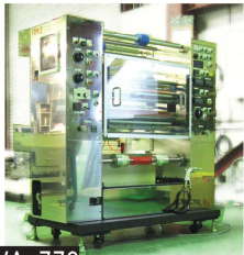
VA-770 外装SUS/巻出エアカプセル 製品巻取/安全カバー