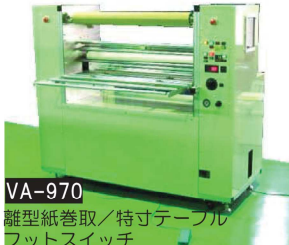
VA-970 離型紙巻取/特寸テーブル フットスイッチ